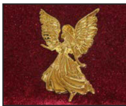
AN-02 5.5 X 3.3 cm