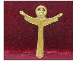
J-01 5.1 X 4 cm