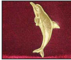
D-02 11 X 4 cm