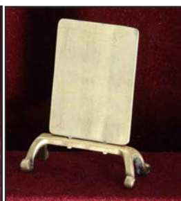
Pied de cadre (PC-09)*