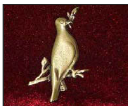
C-05 5 X 3.1 cm