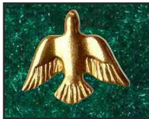
Colombe Or 01†