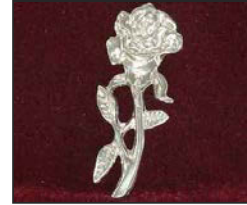
R-01 8.5 X 3 cm