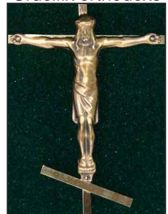
Hauteur : 25.2 cm (10 po.)

Les corpus de tous les crucifix, à l'exception du crucifix orthodoxe, sont offerts en trois tons, soit ; Laiton, Cuivre et Argent