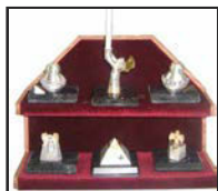
Présentoir à mini-urnes