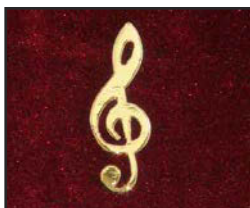
CL-S-02 5 X 1.7 cm