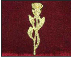
R-02 7.6 X 2.2 cm