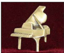
P-01 9 X 7.5 cm