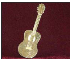
G-01 10 X 3.5 cm