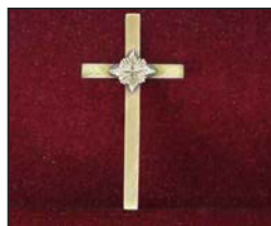
CX-01 7.5 X 3.8 cm