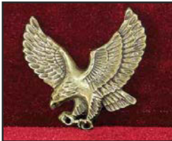
Ai-01 8.6 X 7.8 cm