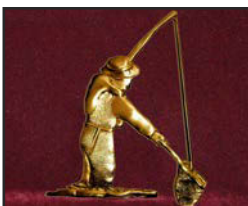
Pêc-02 10.2 X 12.4 cm

10 % de rabais pour une quantité de 50 appliqués, qui peuvent être des modèles différents, et 15 % pour 100