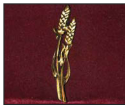
B-03 12.5 X 2.5 cm