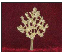
A-03 7 X 5 cm