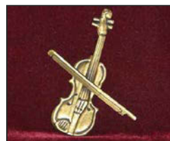
V-01 10 X 8 cm