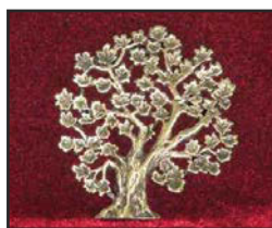
A-02 5.7 X 5 cm