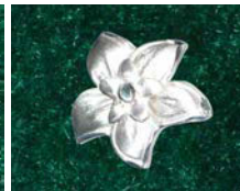
Bouton d'Or 02*