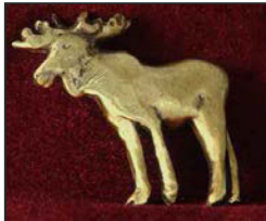
Ori-02 5.8 X 6.1 cm