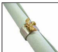
Anneau pour textes