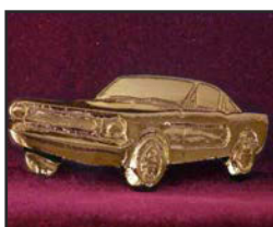
Au-01 7.8 X 3.3 cm