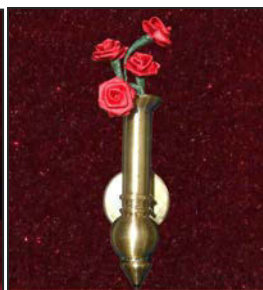
Vase-01 Pour columbarium