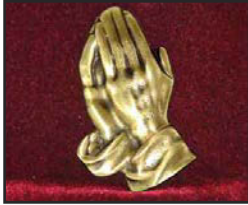
M-01 9 X 4 cm