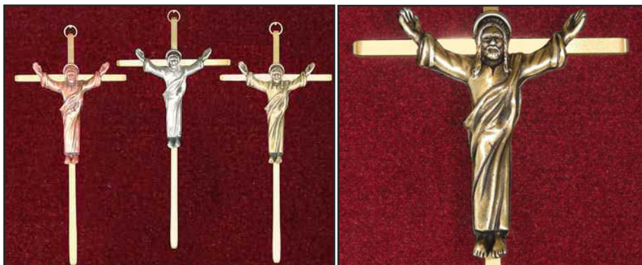
Hauteur : 17.8 cm (7 po.)