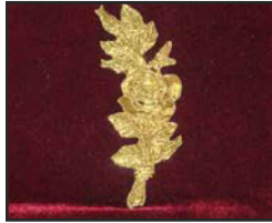
R-04 12.5 X 5 cm