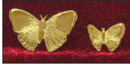
PA-01 7.9 X 6.8 cm