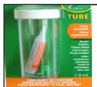
Colle Krazy Glue