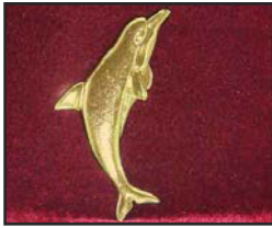
D-01 11 X 4 cm