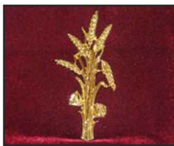
B-02 15 X 7 cm