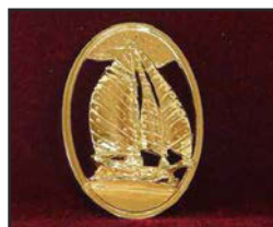
Voi-02 5.6 X 8.4 cm