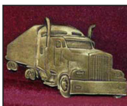
Ca-01 7.6 X 4.2 cm