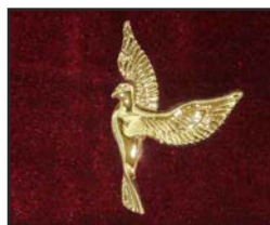
C-04 7 X 3 cm