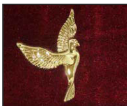
C-03 7 X 3 cm