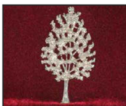
A-01 10.5 X 6 cm

Offert en trois tons : Laiton antique - Or brillant - Étain brossé