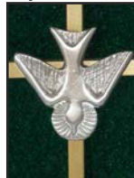
H : 11.4 cm (4.5 po.)