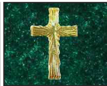
Croix à rayon†