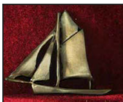
Voi-01 7.1 X 6 cm