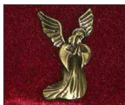
AN-01 5.2 X 2.8 cm