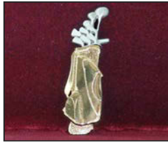
Go-01 2.3 X 7.3 cm