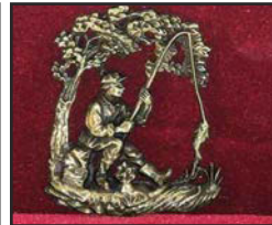
Pêc-01 7.8 X 8.9 cm