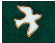
Colombe blanche et or