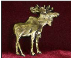
Ori-01 6.1 X 6 cm