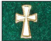
Croix blanche et or