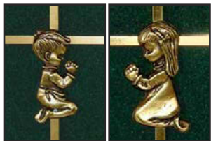
Hauteur : 17.8 cm (7 po.)