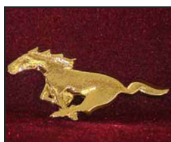
Ch-01 7.2 X 3.6 cm