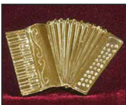
AC-01 6.5 X 4 cm