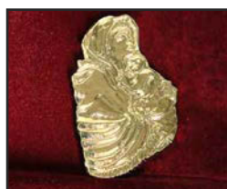
Mad-01 6.3 X 10.1 cm