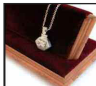
Présentoir à pendentifs