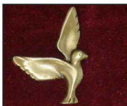
C-01 5.5 X 4 cm