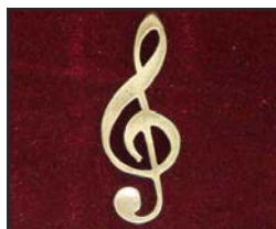
CL-S-01 8 X 3 cm