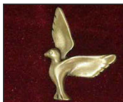
C-02 5.5 X 4 cm