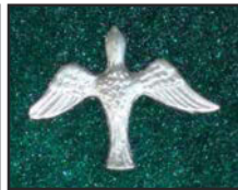
Colombe Or 02*