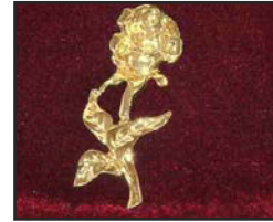
R-05 7 X 3 cm