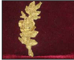
R-03 12.5 X 5 cm