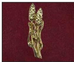
B-01 7 X 2 cm