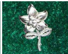
Bouton d'Or 01*